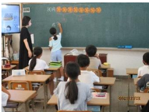
(裁縫ボランティアの方々)5名