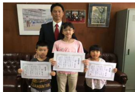
(6月28日に表彰式をしました)