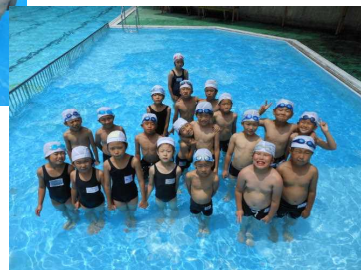
《全員集合した二年生》

夏休みに入り、7月中はプール開放、水泳教室を行いました。4年生から上の学年で水泳の苦手な子を対象にした水泳教室では、どの子も泳げるようになるようと一生懸命にがんばりました。