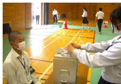
記載を終えたら、投票用紙を投票箱へ