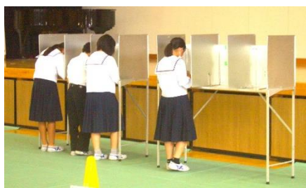
記載台で必要事項を記載します