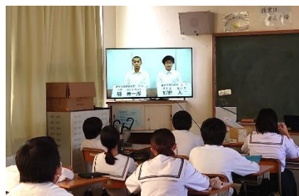
政見放送スタイルによる演説

選挙の結果、新しい生徒会役員が決まりましたのでお知らせします。例年、生徒会役員は、よりよい学校づくりに向け積極的に活動し、様々なことを実現しています。重責を担うこととなりますが、よろしくお願ひします。