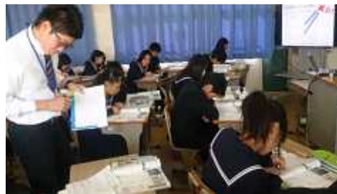
電子黒板による授業