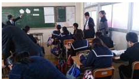
視覚にうったえる教材の提示