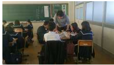
話し合い活動への支援