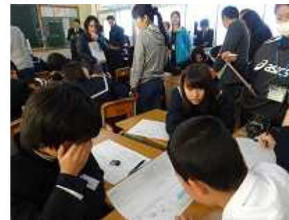
聴き合える関係づくり(グループ)