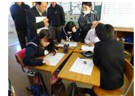
ジャンプの課題に自力で挑戦