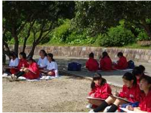
1年生(東公園入り口付近)