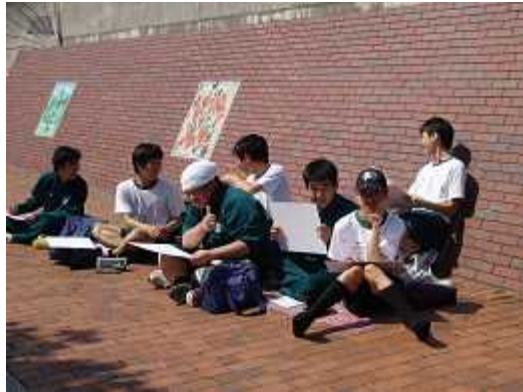
3年生(東公園球場付近)