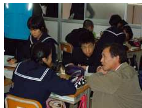
道徳: グループ学習への支援