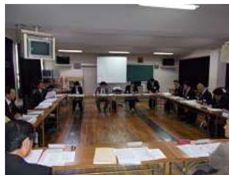
推進校等による連絡協議会・情報交換会