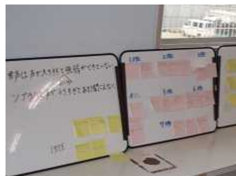
言語活動の充実を図るため発表ボードの活用 グループ学習