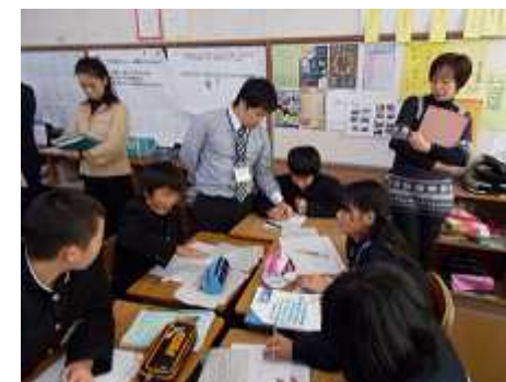
数学科: グループ学習への支援