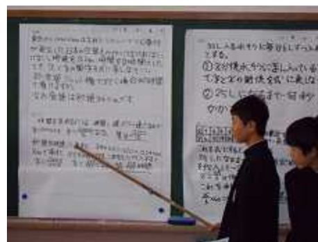
数学: 拡大コピーを活用し考え方を説明