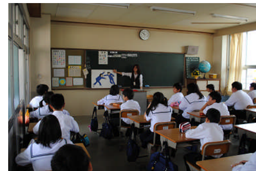
（少年サポートセンター職員による授業）