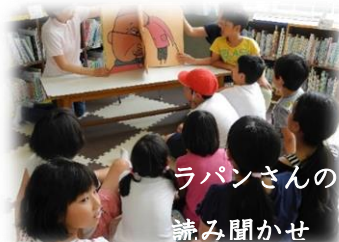
ラパンさんの 読み聞かせ