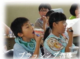
ブラッシング指導