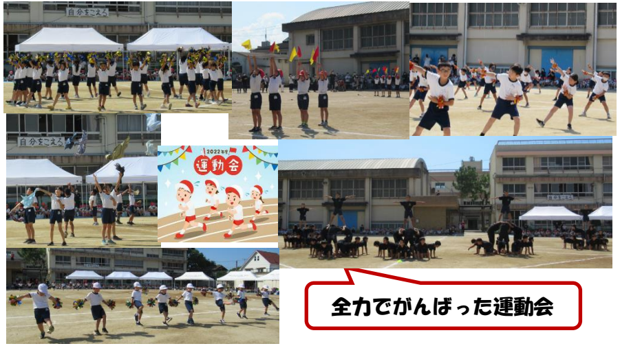
全力でがんばった運動会