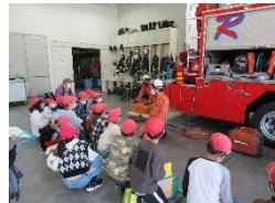
消防署の学習 砂山保育所との交流