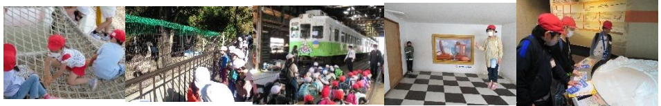
「遠足」わんぱく公園・和歌山城・たみ電車・エネルギーランド・稲むらの火の館