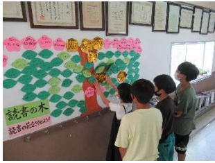
読書100冊にチャレンジ あんしょう名人にチャレンジ