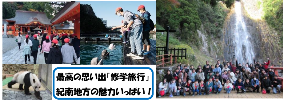
最高の思い出「修学旅行」 紀南地方の魅力いっぱい!