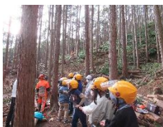
森林体験教室 ろう学校との交流学習