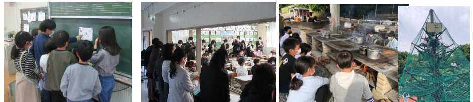
謎解きクイズ大会