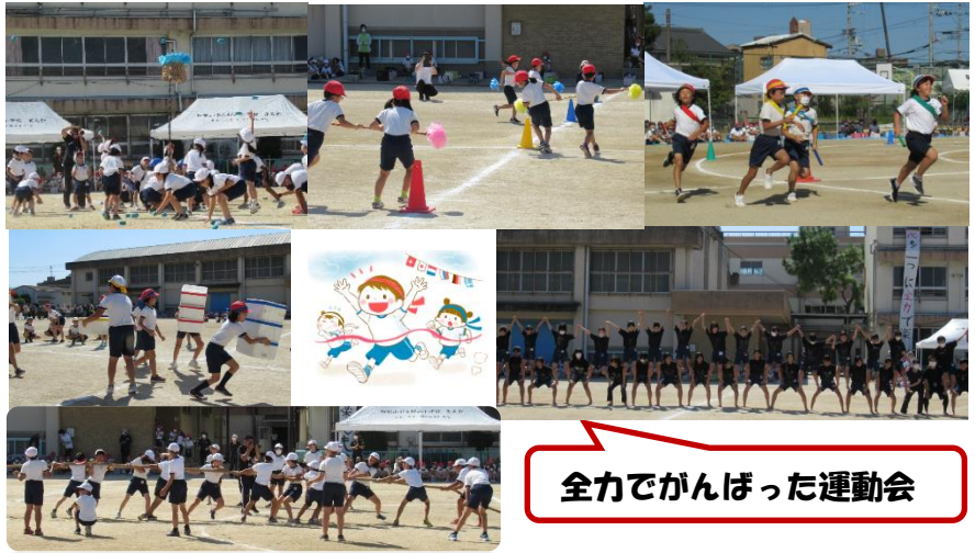
全力でがんばった運動会