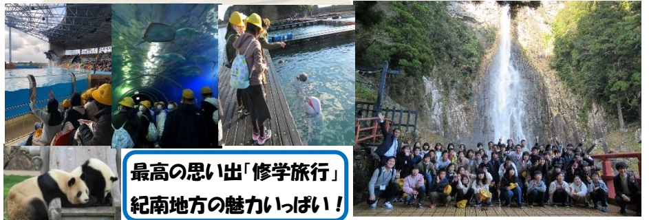
最高の思い出「修学旅行」 紀南地方の魅力いっぱい!