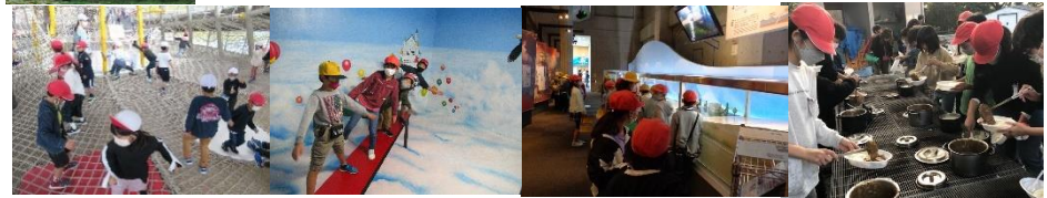
「秋の遠足」わんぱく公園・エネルギーランド・稲むらの火の館 5年加木合宿