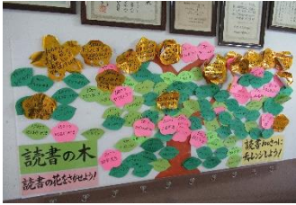
読書100冊にチャレンジ あんしょう名人にチャレンジ