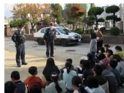
警察署の学習 砂山保育所との交流