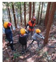
森林体験教室 ろう学校との交流学习