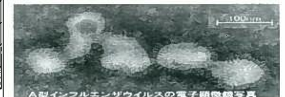
A型インフルエンザウイルスの電子顕微鏡写真

また、参観にあわせて14、15日に校内工作展を図書室で行っています。子ども達の力作もゆっくり見てあげてください。