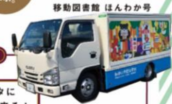
移動図書館 はんわか号