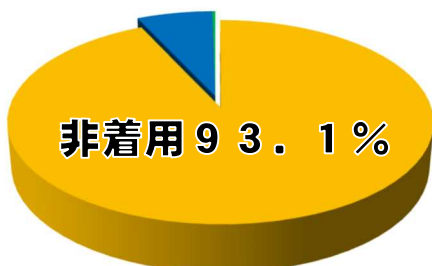
自転車乗用中の死亡事故におけるヘルメットの着用状況