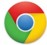
<インターネット ブラウザ>