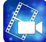
< powerDirector >

簡単操作の動画編 集アプリです。短時 間で本格的・高画 質なビデオを作成 できます。