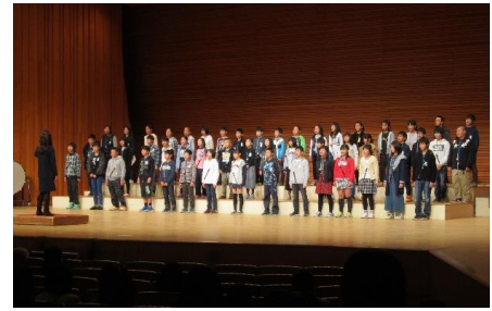
〔6年生が参加した市音楽会〕

年生が参加した12月2日（金）の市音楽会と12月4日（日）に行われた市PTA合唱祭です。ともに、市民会館で実施されました。市PTA合唱祭は、保護者の