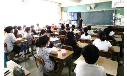
教員免許取得実習