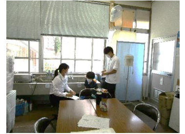
保健師になるための看護実習