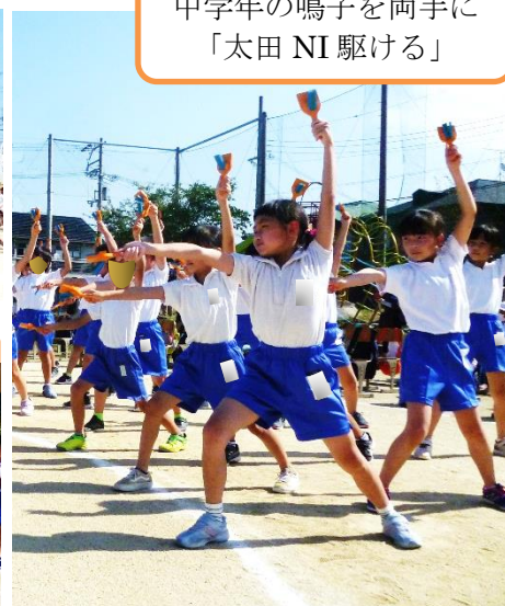
中学年の鳴子を両手に「太田NI駆ける」