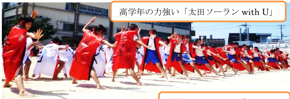
高学年の力強い「太田ソーラン with U」

9月25日に行われました運動会にご参観いただき、誠にありがとうございました。素晴らしい秋晴れの下、どの子も走の種目と表現ダンスの種目に精いっぱい取り組んでいました。3週間の練習期間がありましたが、先生たちの立てた計画にしたがって、とても意欲的に取り組んでいました。その成果が十分にさせた運動会になったと思います。