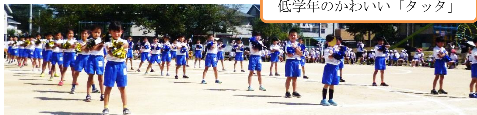
低学年のかわいい「タッタ」

今年の運動会では、保護者の参観者を各家庭2名までに限定させていただいたり、時間帯を低・中・高学年で区切らせていただいたりと、感染対策をとらせていただきました。保護者のみなさまにはたいへん参加しづらい運動会になったと思いますが、ご協力ありがとうございました。感染症は少し落ち着いたとはいえ、まだまだ油断することはできない状況です。今後ともご理解ご協力をお願い申し上げます。