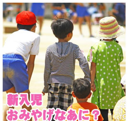
新入児 おみやげなあに？ 来年入学予定の新入児が運動会に遊びに来てくれました。