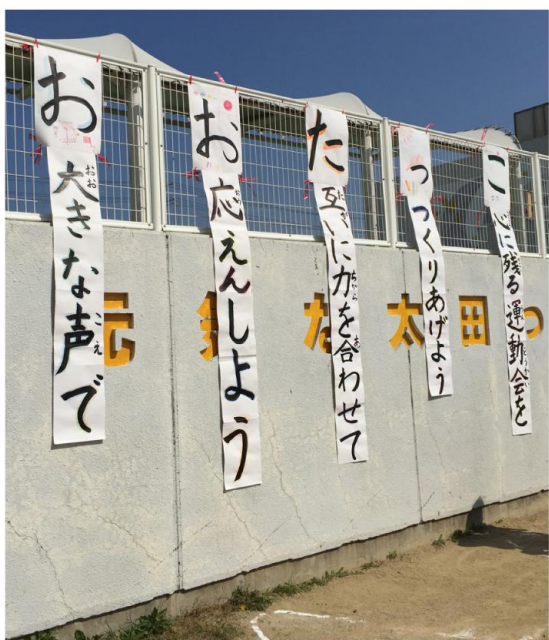
運動会のテーマは「おたっこ」

練習では何度も失敗した組体操、ひとつひとつ完成していくと嬉しかったね。本番では、みんなどれも練習以上にうまくできたよ！一度失敗したピラミッド、再チャレンジで見事完成させました！あきらめない心が大切です。