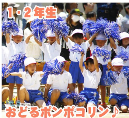
1年生と2年生の「踊るぽんぽこりん」みんな元気いっぱい！！笑顔いっぱい！！かわいく楽しく踊りました！！

今年の運動会は、秋に行われる「2015紀の国わかやま国体・紀の国わかやま大会」のため5月30日(土)に行われました。 新学期早々に運動会の練習がはじまりました。約1ヶ月と短い期間の中、汗まみれになりながら、一生懸命練習に励んできた子どもたち、この日いよいよ本番を迎えました。 当日は好天にも恵まれ、絶好の運動会日和となりました。 校長先生の挨拶、約360名の児童代表による開会宣言が行われた後、全員で準備体操をし、各種競技が始まりました。 先生や保護者の見守る中、子どもたちは元気な笑顔で、お友達を大きな声で応援し、自分に来ることを精いっぱい頑張りました。