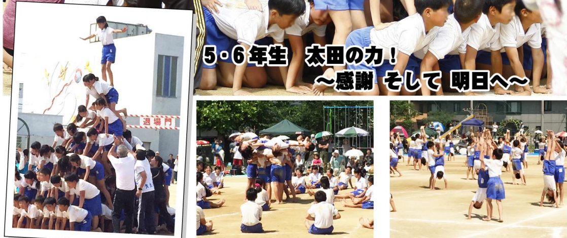
5・6年生 太田の力！ ～感謝 そして明日～

練習では何度も失敗した組体操、ひとつひとつ完成していくと嬉しかったね。本番では、みんなどれも練習以上にうまくできたよ！一度失敗したピラミッド、再チャレンジで見事完成させました！あきらめない心が大切です。