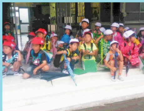
楽しみにしていた「町探検」、雨でしたが仲良く並んで行きました。

子どもたちも、競技を終えるたび、とても大きな喜びと達成感を得られたのではないのでしょうか? 子どもの真剣な姿や笑顔に成長を実感し、嬉しく思われた事でしょう。 ご指導くださった先生方や、ご協力いただいた保護者の方々には感謝の気持ちでいっぱいです。