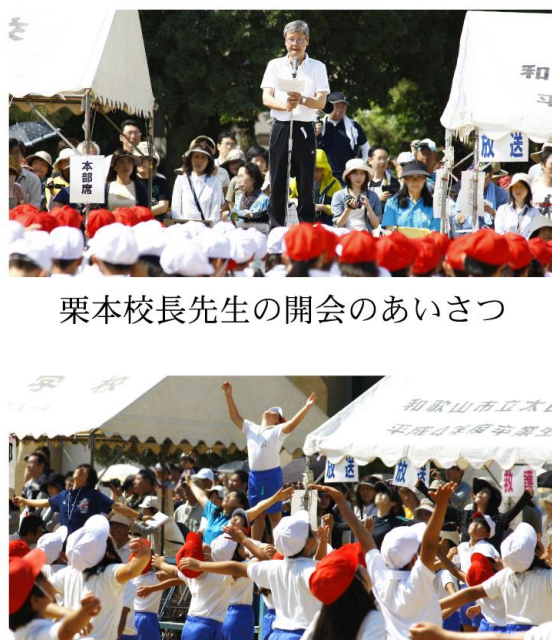
栗本校長先生の開会のあいさつ