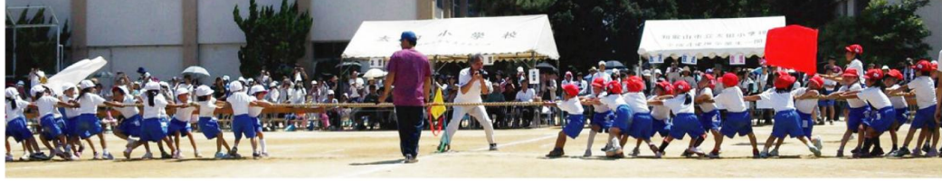
1年生、2年生どちらも頑張って!お兄ちゃんお姉ちゃんと一生懸命引っ張りました!!みんな頑張りましたね!