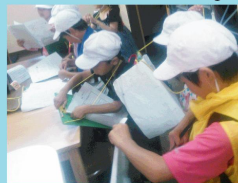
和歌山駅近くの食いもん屋「夜食呈」さんにて、人気メニューなどを質問して一生懸命メモしていました。