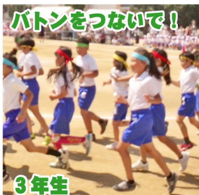
3年生 四色対抗リレー。皆で力をあわせて走りました。