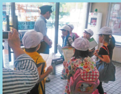
JR和歌山駅の利用客が1日2万人だと聞いて、人の多さに子ども達は驚いていました。