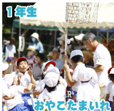
1年生 おやこたまいれ はじめての運動会！玉を素早く拾って、時間いっぱい投げました。