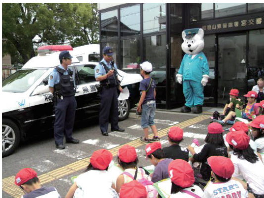
きしゅう君登場に「わ～大きい！！」

曇り空、傘を持っでの出発でしたが、涼しくて、皆先生とお巡りさんのお話を最後までマナー良く聞くことが出来ました。