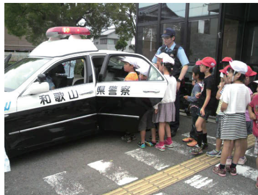
パトカーに順番に乗せてもらう。