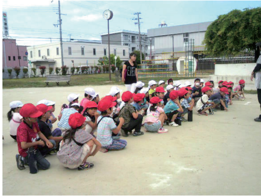
良いお天気で先生の注意を聞いてから 皆でタップリ遊びました。