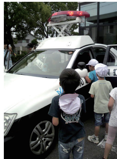
パトランプを上げたり下げたり → サイレンを鳴らしたり。