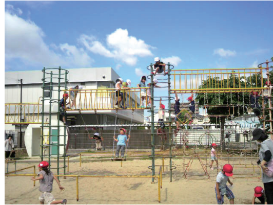
高い所から先生見て見て～。