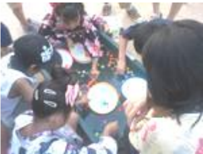
女の子に大人気。スーパーボールすくい イッパイすくえたかな