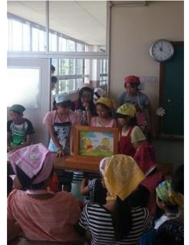
ケーキが焼けるまでの間は みんなでなぞなぞや紙芝居で 楽しみました。