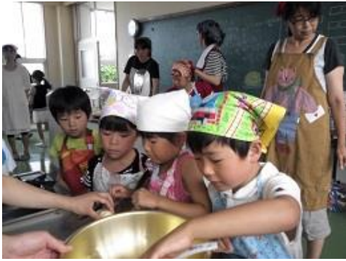
40名の子どもたちと、保護者数名が集まり、 6～8人ほどでグループに分かれ、 皆でワイワイ楽しくスタートしました。