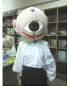
太田まつり恒例のお化け屋敷