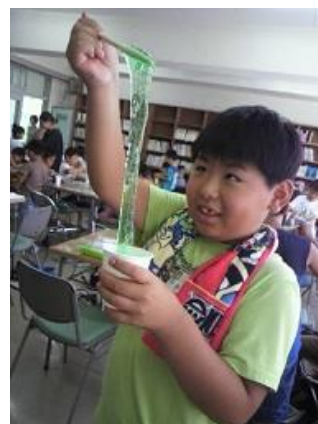
美味しそうだけど食べたらダメよ☆