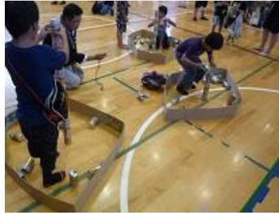
体育館でも先生方や自治会の方々、卒業保護者有志の皆さんのご協力により、たくさんのゲームで大盛り上がりでした。