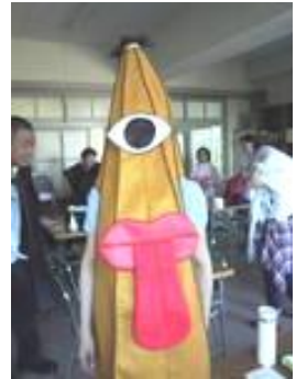
暑さに負けずご苦労様。