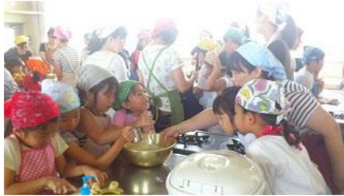
みんな楽しそうに協力していました。