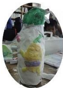
ふなっしーだ ヒャッハー!