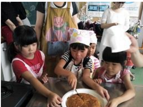
出来上がったケーキもとても良い匂いで、 皆嬉しそうに切り分けていました。