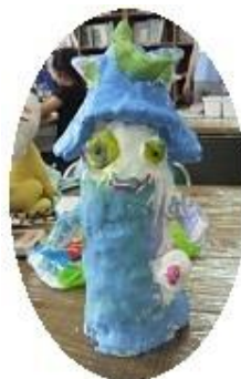
こちらは ブシニャン