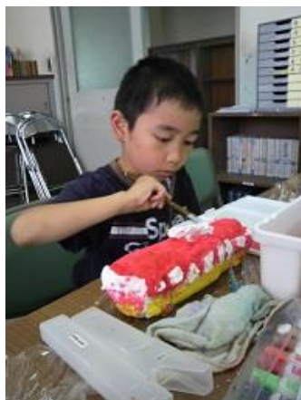
一生懸命がんばっています。 赤い電車だカッコいい!