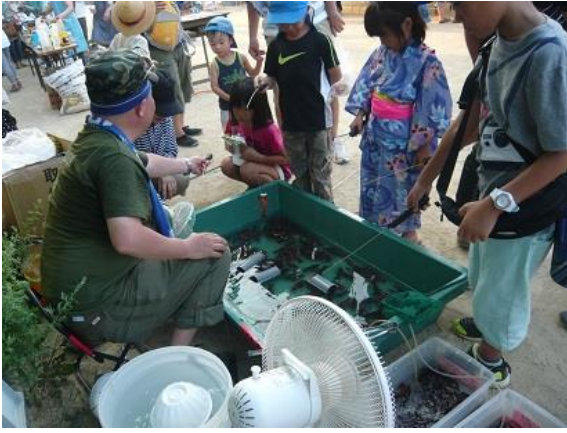
「ザリガニとあそぼう」では専用のつりざおで子どもたちがザリガニをつりあげていました。大きなザリガニがたくさんいました。

7月26日(土) 風が吹くものの、まだ日差しがさんさんと照り付ける中、生徒達が待ちに待ったお楽しみイベント「太田まつり」を開催しました！！ 子どもみこしに始まり、お楽しみ抽選会、そしてラストの花火大会まで大人も子どもたちも楽しく過ごしました。