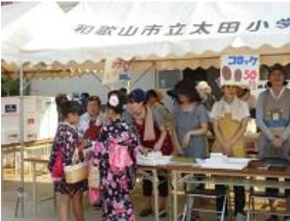
フードコーナーは、美味しそうなものばかり！ たくさんの人だかりができました。