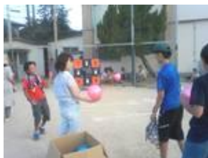
男の子には、ストラックアウト！ 真剣そのものでした。