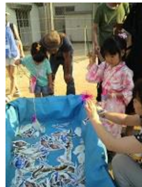
魚釣りではみんな一生懸命。 大きな魚釣れたかな？