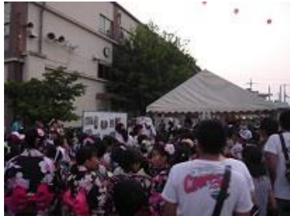
「おたのしみ抽選会」は、大勢集まって盛り上がりました！