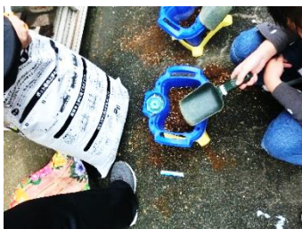
ハウセンカを植える様子

2年生の廊下には、子どもたちに雑巾の片づけ方を示すポスターが貼ってありました。そして、ポスターの下を見ると、ポスターとそっくり片づけられた雑巾とバケツが・・・あまりの素敵さに思わず写真を撮ってしまいました。