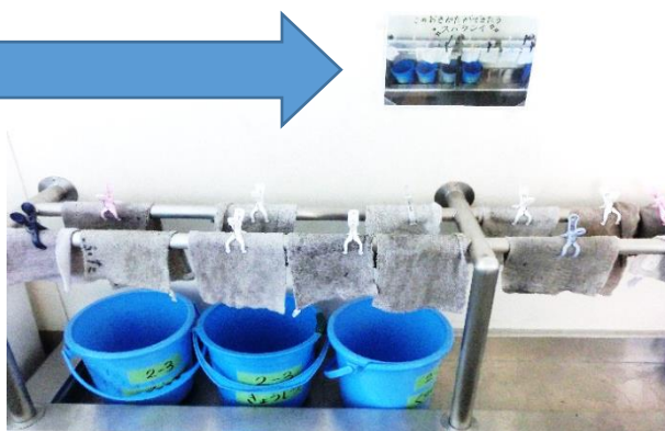
2年生の雑巾とバケツの様子

2年生の廊下には、子どもたちに雑巾の片づけ方を示すポスターが貼ってありました。そして、ポスターの下を見ると、ポスターとそっくり片づけられた雑巾とバケツが・・・あまりの素敵さに思わず写真を撮ってしまいました。