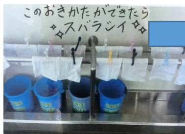
2年生の廊下のポスター

朝、「おはようございます。」と、子どもたちの元気な声で1日が始まります。そして、始業のチャイムが鳴る前に子どもたちは移動し、掃除を始めます。掃除に向かう態度を養うため、各担任は学年に合わせ、工夫して掃除の指導をしています。