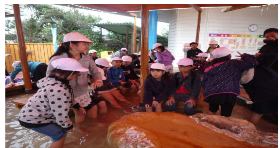
3・4年生 白浜エネルギーランド