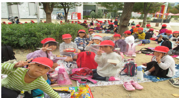
秋の遠足 1・2年生 キッズプラザ