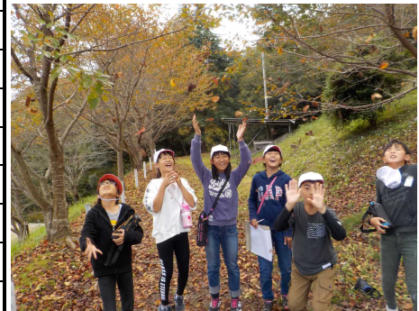
5年生 紀北青少年の家