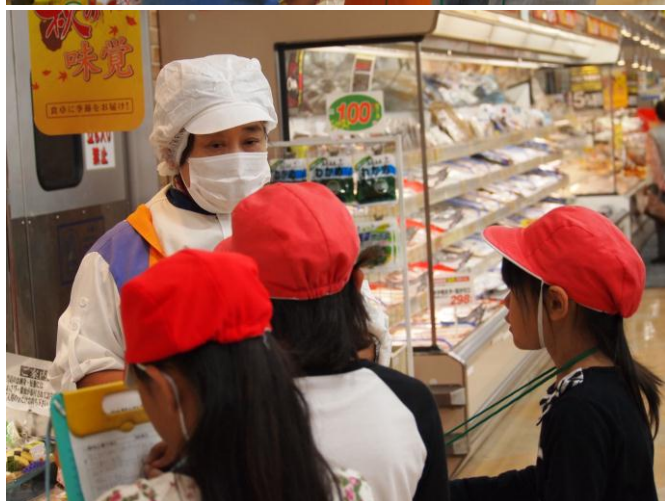
プライスカットの皆様、親切に教えてください、ありがとうございました。