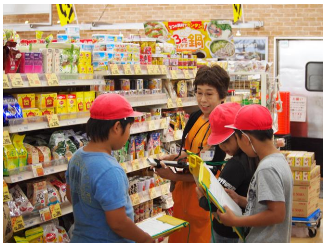
3年スーパーマーケット見学↓