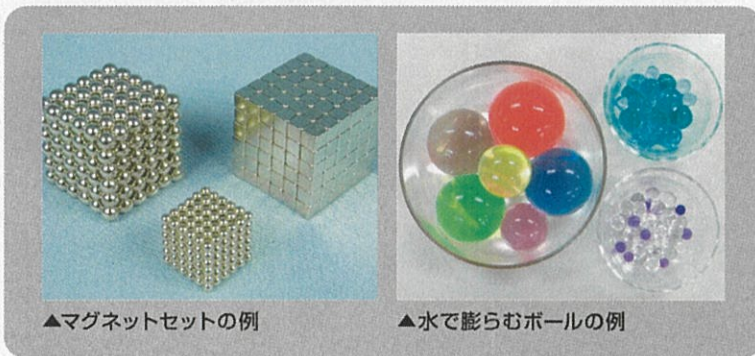
▲マグネットセットの例