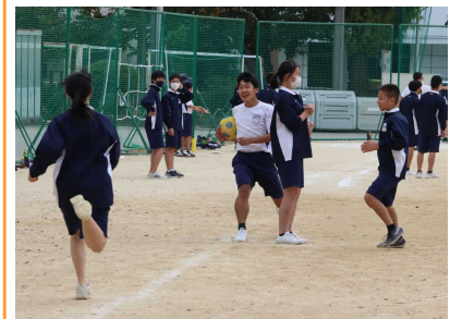
学年レクリエーション(10月27日)