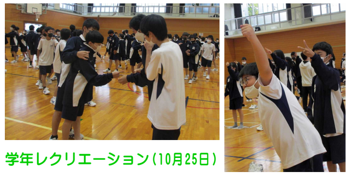
学年レクリエーション(10月25日)

校外学習と学年レクリエーションを無事(?) 終えて、次は「合唱コンクール」と「必勝祭」ですね。どちらもクラスの団結力が試される時。日頃から培ってきた仲間との絆を今こそみんなの前で披露してくれると嬉しいと思います。