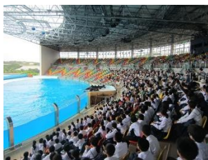
大迫力!!イルカショー🐬