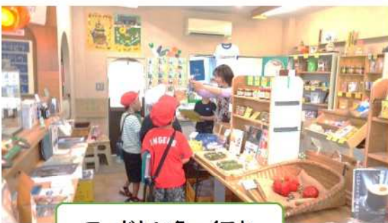
フードセンターイワセ

6月14日（金）2年生がJA、ウエルシア、ファミリーマート、フードセンターイワセ、駄菓子屋さん、農業屋の6か所に分かれて、見学し、いろいろな質問をしてきました。