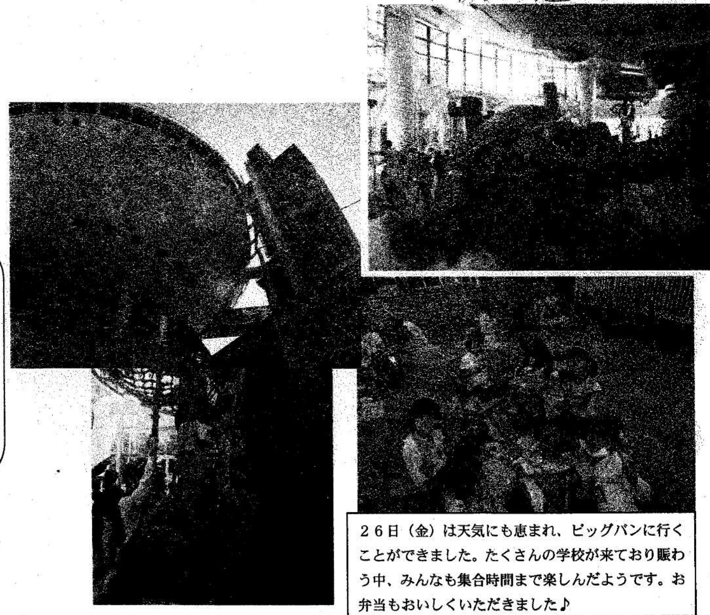
26日(金)は天気にも恵まれ、ビッグバンに行くことができました。たくさんの学校が来ており賑わう中、みんなも集合時間まで楽しんだようです。お弁当もおいしくいただきました♪

そろそろ連絡帳を買い換える頃だと思います。同じ大きさのもので8~10行のもの(今使っているものはそのまま使っていて結構です)を購入してください。よろしくお願いいたします。