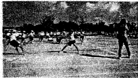
平成最後の TUNAR WARS (5・6年)