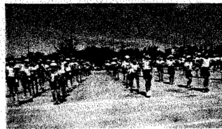
ダンシング・ヒーロー (3・4年)