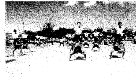
組体操 ~輝きだして走って~ (5・6年)