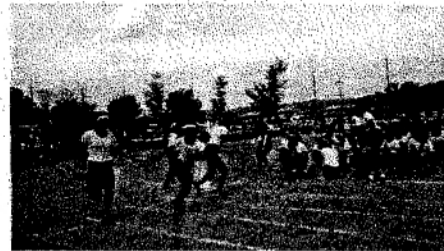
Ready? Set Go !! (6年)