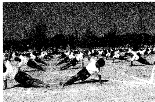
組体操2017 ~信~ (5・6年)