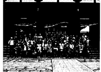
東大寺の前で6年生全員

9月も下旬となり、朝夕など随分涼しくなってきました。 9月7日(月)8日(火)に実施された6年生の奈良・京都へ修学旅行は台風が近づく中、ほとんど雨に降られず、東大寺や清水寺・金閣寺や二条城、太秦映画村等をまわることができました。 9月24日(木)には、5・6年生が国体観戦に河南体育館に行き、バスケットボールの試合を見ることができました。 今年は運動会は終了していますので、秋はじっくりと学習などに取り組みましょう。