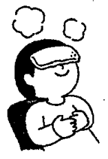
目が疲れたときは蒸しタオルなどで温める