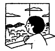
たまには遠くの景色を眺めてリラックス