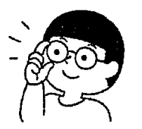
メガネ、コンタクトは自分の度にあったものに

「愛護」とは、「大切に作る、守る」という意味です。みなさん、自分の目を大切にしていますか? 目に優しい生活を意識してみましよう。