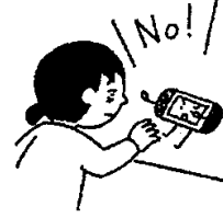
ゲームやスマホの見すぎに注意