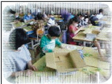
紀州うすい豆をむいたよ