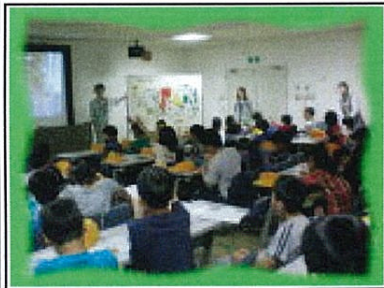
ゴミを減量するぞ!