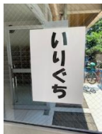
上靴に履き替えて体育館へ