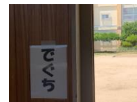
チェックして教室へ