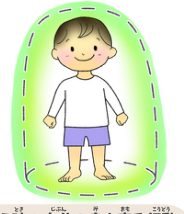
いざという時の自分の身を守る行動

プライベートゾーンって？ ◎髪の毛から指の先まで ☆特に下着（水着）で隠れる部分＋口