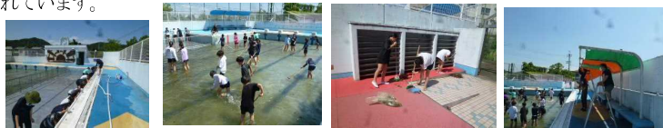
プールの壁みがき 床みがき 落ち葉を掃除 日よけもOK！