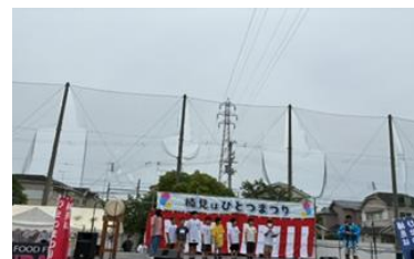
舞台上に並ぶ鶏会社の子供達

予定していた7日が雨のため、14日に延期したお祭りでしたが、大勢の方が参加され、大変な賑わいでした。舞台ではいろいろな催しが行われたのですが、その中に飛び入りで、5年生の子供達の有志でつくる「鶏会社」のアピールをする時間をいただき、貴重な体験をすることができました。募金箱には38,032円ものご寄付が集まりました。主にエサ代として活用させていただきます。ありがとうございました。