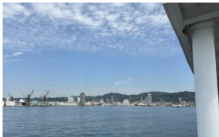
遊覧船からの神戸港

阪神工業地帯の工場群が見え、また、神戸港では遊覧船に乗って港の様子を見学しました。キリンのような大きなクレーンも見ることができました。