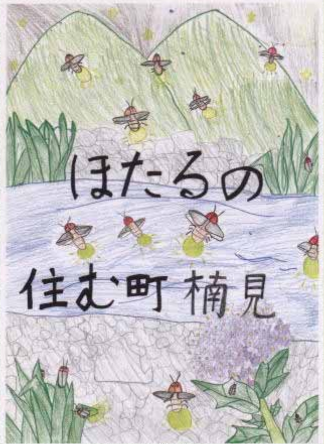
この絵は、児童遊園にあるタイル絵です。