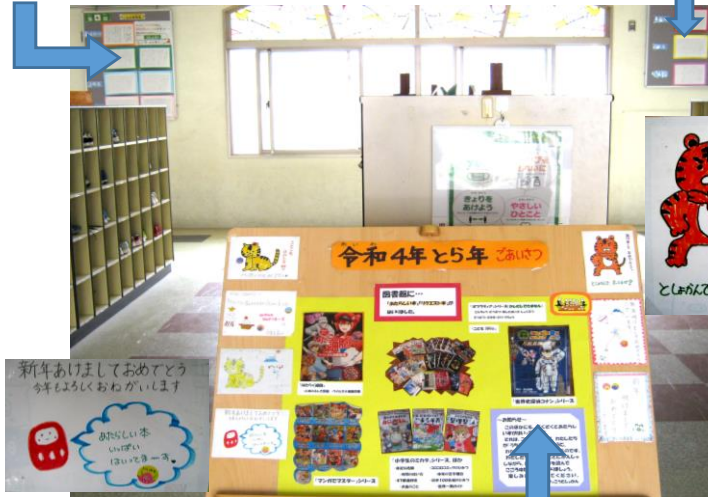
図書委員会の掲示板

貴志小学校の玄関を入ると、まず目に飛び込んでくる図書委員会の掲示板。「令和4年とら年ごあいさつ」の文字と共に図書の本の紹介と年賀状が掲示されています。今年は外で遊べないだろうということで、子供たちのために補助金をいただき、本をたくさん買うことができました。