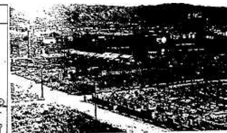
空襲後の和歌山市(城の北東) (右上の建物の残骸は元の丸正百貨店(本町二丁)) (空襲後の和歌山市の写真)