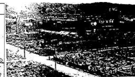
空襲後の和歌山市(城の北東) (右上の建物の残骸は元の丸正百貨店(本町二)) (空襲後の和歌山市の写真)