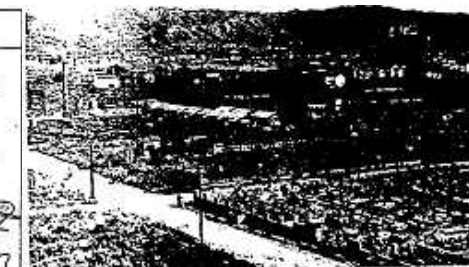
空襲後の和歌山市(城の北東) (右上の建物の残骸は元の丸正百貨店(本町二)) (空襲後の和歌山市の写真)