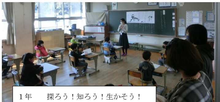
1年 探ろう!知ろう!生かそう! ～学校から加太のまちへ飛び出そう～

本校研究主題のもと、子供たちは「地域」を知り、「地域」に親しみ、「地域」に学ぶことを大切にし、取り組んできた実践を、授業公開3つ(1～5年の授業)(園児と1年生の合同保育授業)(6年授業)に分けて発表することができました。