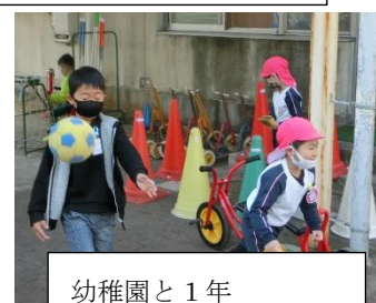
幼稚園と1年 のびのび遊ぶ加太っ子