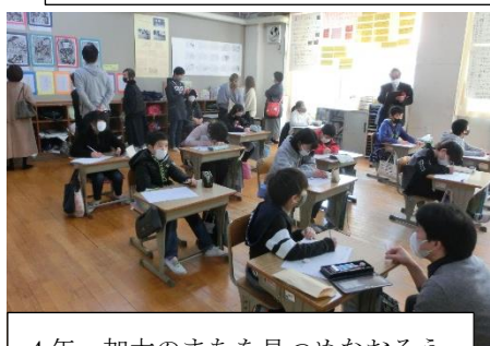
4年 加太のまちを見つめなおそう ～ボードゲーム作りを通して～