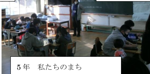
5年 私たちのまち ～加太っていいところやで～