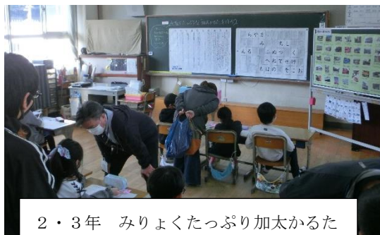
2・3年 みりょくたっぷり加太かるた こんなにすてきなところですよ!