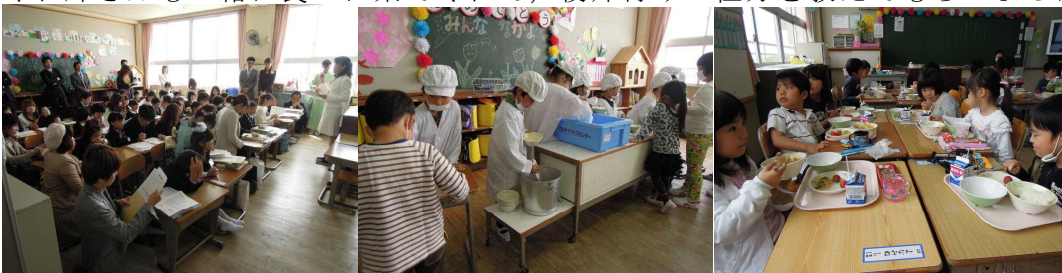
<入学式後の教室で>

4月17日、最初の給食でした。先生と一緒に上手に準備できました。6年生のお兄さんやお姉さんも一緒に食べに来てくれて、後片付けの仕方を教えてもらいました。