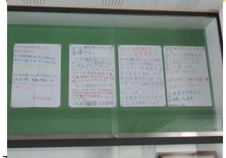
後期議長団の伝達集会 と 議長団の“公約” (学校玄関に掲示しています)

9月の運動会では、20年目の今年少し趣向を変えてみました。昨年よりみんなの前に立って、話したり指揮したりする子が増えました。できるだけ子どもたちに役割を与え、よい緊張感と達成感を味わわせてやりたいと考えたからです。学校行事は、本来、教職員が企画・運営するものですが、主役は子どもたちです。学校行事を子どもたちが成長する機会と捉え、子どもたちに感動を与え、一人一人の成長と組織の高まりを期待して取り組んでいきたいと考えています。