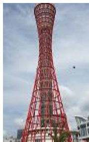
神戸ポートタワー

阪神淡路大震災当時のまま保存されている、神戸港のメモリアルパークを見学しました。