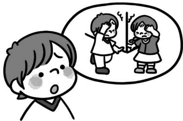
ぼんやりしていた...