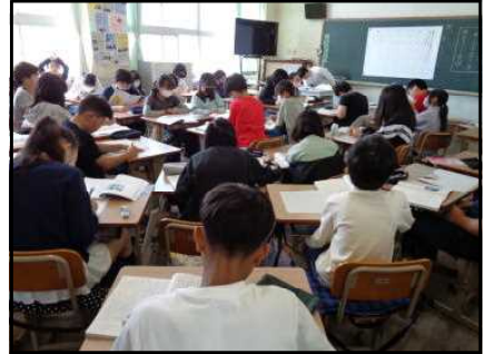
↑ <5年生の授業風景> ↑

本校では、授業で「友だちとの関わり」を大切に考え、自分の考えをしっかりと持ちつつ、友だちとの関わりの中でそれをさらに磨いていくことができるような子どもを育てていきたいと考えています。そこで「訊き合う」、最後まで「応える」、なかまとともに「考える」ことを大切にしたいと思っています。 まずは「自分で考える」 事から始まり、わからないこと疑問点などは「訊き合う」、そして 「振り返る」 ことで 学びを確かなもの にしていく、ことができればと考えています。学びの「主体性」を特に大切にしていければと考えていますので、お家でも子どもたちのやる気、意欲を支えていただければありがたいです。「うち学」（自主学習）も頑張っている子どもたち、どうぞ子どもたちのうち学ノートも見せてあげてくださいね！